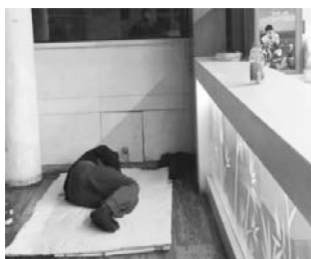
24 小时商业设施成为理想的过夜场所