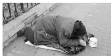
北京大学东南门口的老年女性乞丐者

讨方式获得生存资源的街头流浪者。因此,在这一语境下,可以将乞讨类的街头流浪者看作是一种被迫进入或自愿进入的生活方式。