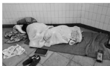
拒绝社会交往和互动是这类街头流浪者的典型特征

在研究团队看来,这一类原子化露宿者与前面所描述的其他类型至少有两个重要差别:1) 他们的经济处境看起来最为窘迫,因为我们很少能够在白天通过观察,发现他们的生存行为(如进食)和边缘性经济行为(如乞讨);2) 此外,不但看不到他们与外部世界进行社会交往和社会互动的意愿,就连他们与同在街头流浪的其他同类的社会交往和互动,也很少见得到。新闻媒体上偶尔报道的流浪汉冻死或病死的现象,其主角应该就是这一类原子化的极端困境者。这应该是中国都市街头流浪现象中社会问题程度最深的一个亚类:他们主要的问题是,由于种种原因和生存体系(家庭、劳动力市场、社会救济和救助体系等)发生了系统性的断裂,而陷入到极端的不利处境。