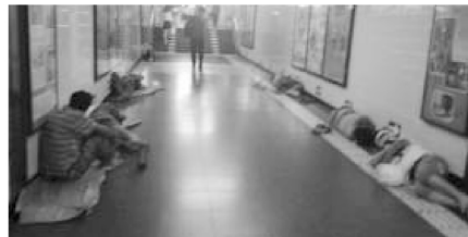
正午,民工们在木樨地地铁站阴凉通风处午休

从文化嵌入性的角度来看,当代中国都市的街头流浪现象实际上具有多重的社会含义:作为一种自愿选择的生活方式;作为底层民众生计实践的经济机会;以及作为文化上允许的经济适应手段,等等。因此,文化上促发街头流浪现象的理论线索也正在于此:(1)经济适应动机是文化上支撑街头流浪(露宿)的一个重要维度:在某些时候,流浪和露宿是利他主义情怀的表征;在另一些时候,流浪和露宿是弱者的道义武器;而在更多的时候,流浪和露宿与节约生存成本直接相关,也与边缘性生计活动融为一体;(2)其次,我们同样需要关注到当代街头流浪现象和历史上的流民文化之间可能存在的文化上的继替关系:随身携带铺盖卷进城的农民工,其关于“恰当住处”的定义,应该是“席地幕天,随遇而安”。假如这样一种关系确实存在,那么在这样一种文化心智的长期浸润下,处于困境的迁移者(流动者),可以集体地对某一特定空间的属性进行重新定义,如将火车站广场、医院门诊厅走廊、桥洞、地下通道等公共设施定义为“文化上许可的露宿场所”。从下面这张照片中,我们也可以看到,在定义“恰当”、“舒适”和“怡然自得”时,底层民众完全拥有自己的文化逻辑:北京建筑工地的一群打工者们,以最简易的符号(铺盖),把一个主要的城市公共空间,集体定义为绝佳的午休空间。