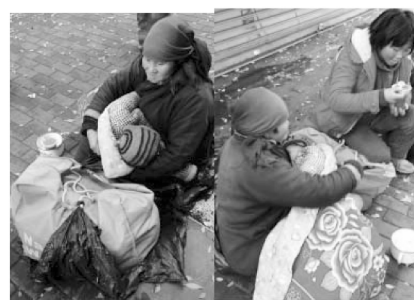
河南婆婆一家:以越轨的方式实现家庭团聚

河南婆婆是典型的农闲外出乞丐者。在五道口地铁站外的各处空间,我曾经多次与她不期而遇;从简单的交谈中,我知道她大概定期地往返北京和老家。每次见她,她的穿着打扮几乎没发生什么变化:深色的棉质外套和外裤,头上有头巾包裹以御寒。2015 年深秋,我在五道口地铁站口的街角遇到了一个怀抱小孩的年轻女子,似乎有临时求乞的意思。因为小孩子的眼神打动了我,我给了年轻女子 10 元纸币。一周之后,我们研究团队的其中一组恰好也访问到了该女子,得知她因为在老家和丈夫发生口角,继而演变为肢体冲突和家庭暴力,一气之下带着孩子前往北京,寻找自己的母亲(一位职业乞丐者)。将近两周之后,我又在五道口地铁站口的街头遇到了该年轻女子和她的孩子。当我见到她的母亲时,我发现她母亲就是我已经熟识的河南婆婆。