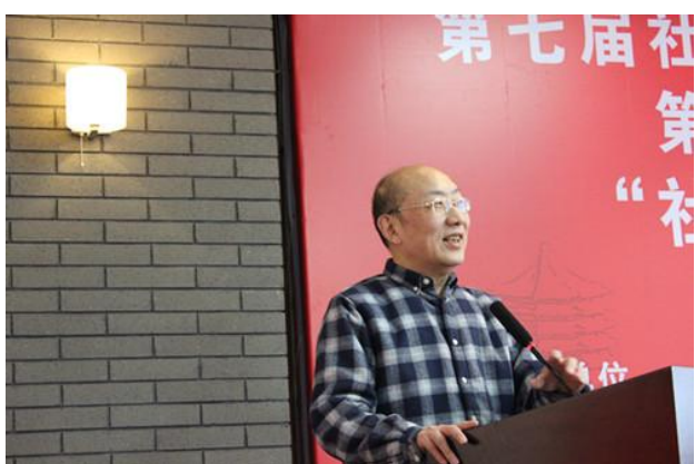
中国社会工作教育协会会长徐永祥致辞