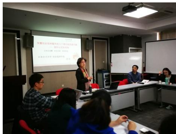
沈洁教授在讲演中

4月21日下午，由北京大学-香港理工大学中国社会工作研究中心和北京大学社会工作硕士教育中心联合主办的社会工作沙龙第40期暨至善系列讲座第4讲“发展社区福利服务的几个理论和实践问题——国际比较的视角”讲座在北京大学举行。此次主讲嘉宾为日本女子大学社会福利学系教授、博士生导师沈洁教授。共有来自北京大学、北京科技大学、北京工业大学耿丹学院等高校的20余名社工教师、学生参加了讲座。讲座由北京大学社会学系教授、中心主任王思斌教授主持。