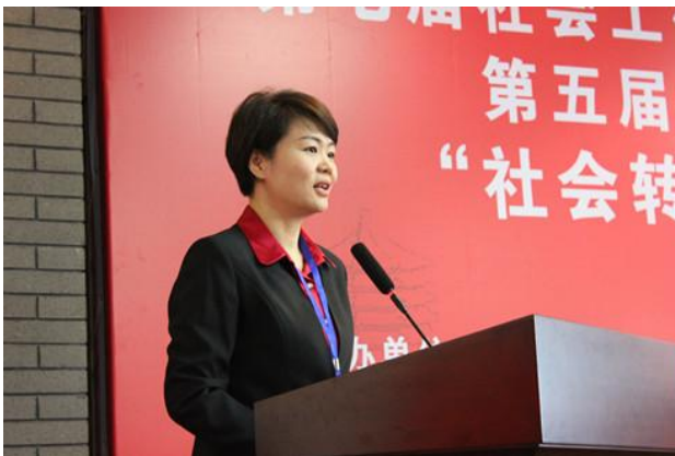
民政部社会工作司司长吕晓莉致辞

此次研讨会的总议题是“社会转型中的家庭服务与社区发展”，分论题包括：经济社会转型给家庭带来的挑战及其回应；家庭服务与社区服务和社区发展；社区社会资本建设与和谐家庭建设；社会工作在家庭服务和社区资本建设中的作用；家庭服务与政策倡导。