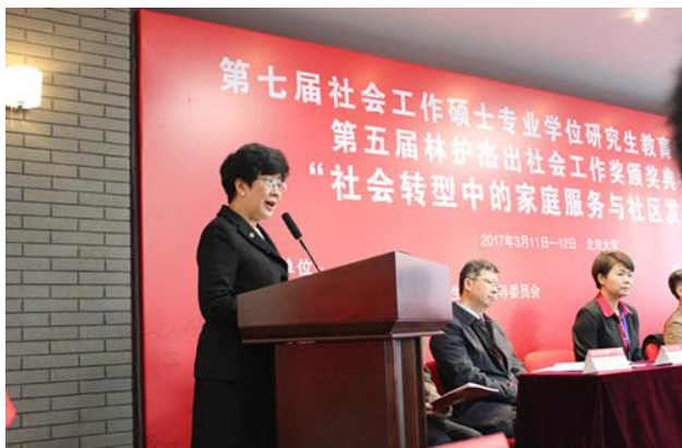
香港理工大学副校长阮曾媛琪致辞