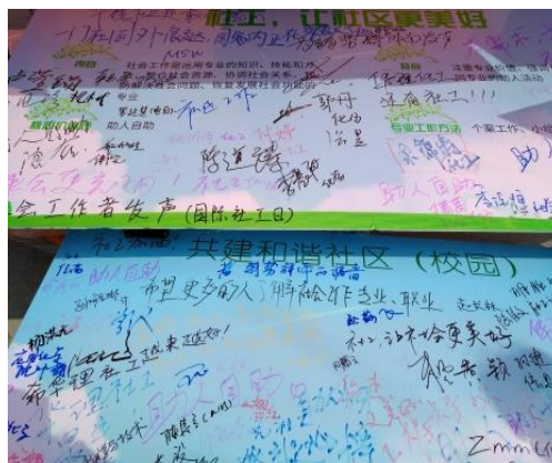
2017年世界社工日主题及学生签名展