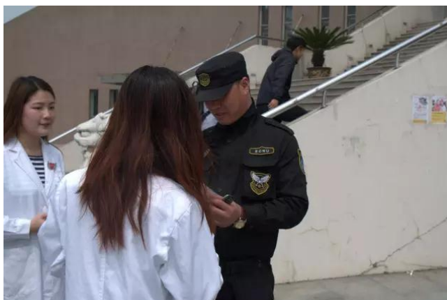
来自于九院的“微笑天使” 向路过的保安进行宣传

本次活动特意邀请到了校外的许多社会工作类机构来参与，不仅丰富了活动的形式与内容，更让到场的学生们与社会工作有了更亲密的接触。社工系学生们主动向经过的师生们介绍关于本次活动的相关信息，并通过精致的宣传材料向大家介绍起社会工作的含义。路过的师生也纷纷来到了签名墙前留下了自己对于社会工作的认可与支持。社工系联系到了上海交通大学医学院附属第九人民医院，为医院的唇裂患儿进行义卖。来自于九院的实习生们，以“微笑天使”之名，为医院患儿们送去微笑与祝福，陪伴他们健康成长。