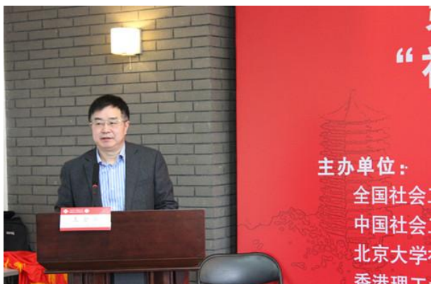
民政部社会救助司司长王金华作专题讲演