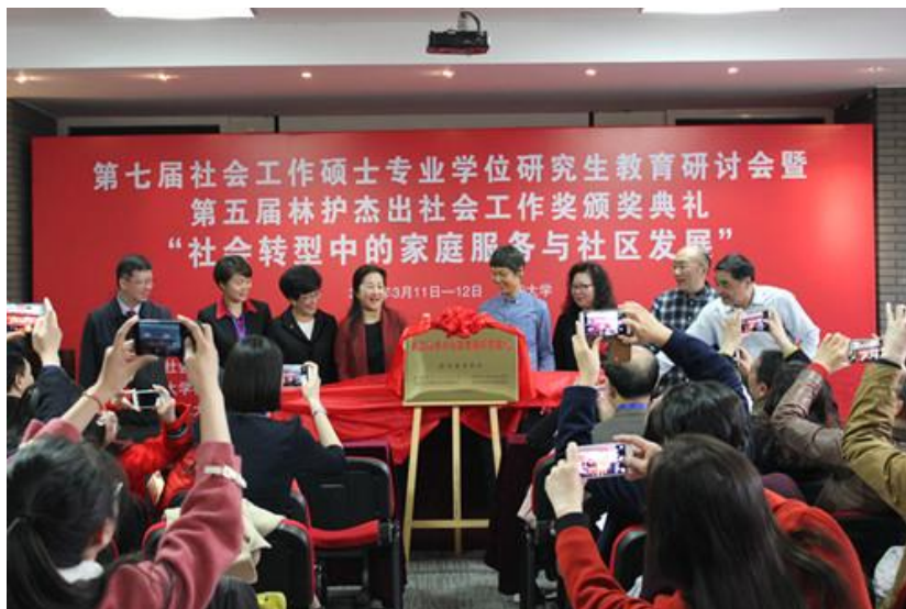
北京大学树村研究基地揭牌仪式

促进科学研究的发展，更好地发挥北京大学在研究和学术研究上“教育-研究-实务”三位一体的优势。