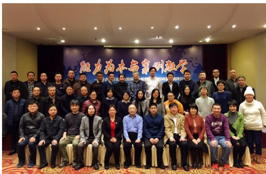
图3 华理、华师大、上师大三校教师与海宁当地部门人员合影