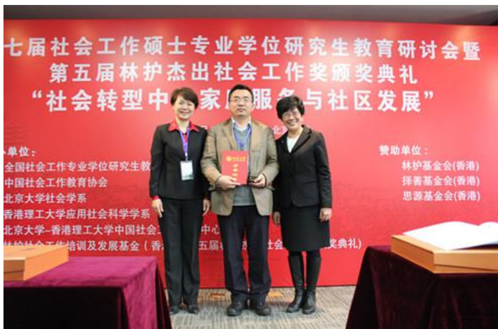
林护杰出社会工作奖评审委员会成员与获奖者代表合影

大会还举行了第五届林护杰出社会工作奖颁奖典礼，对杰出的社会工作专业学生、高校的社会工作实习项目、社会工作服务项目和社会工作学人给予奖励，共有 11 个项目及个人获得奖励。林护杰出社会工作奖是一个专门针对社会工作专业人员和项目的奖项，已连续进行五届，对激励社会工作学生坚守专业价值观、成长为优秀的社会工作者，为做好社会工作示范项目，产生了重要影响。