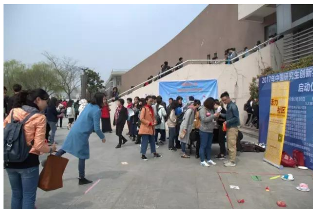
同学们在活力社区的套圈游戏前跃跃欲试

至此，国际社工日宣传画上圆满的句号。华师大社工系的师生和各大社工组织在密切的合作中为校园师生带来了一股来自于社会工作的清风，广大师生们对社会工作的认识与支持也得到了进一步的提升。（华东师范大学社会工作系郭娟 供稿）