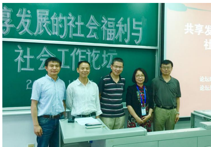
论坛主办方代表合影

熊跃根教授演讲的主题为《迈向发展型的福利国家：对中国未来发展社会的思考》。他总结了福利国家共同具有的国家与社会制度，并表达了对未来发展的美好愿景。彭华民教授的发言主题为《共享发展的组合式普惠型社会福利制度构建研究》。她从中国共享发展与宏观政策推进切入，指出福祉是中国共享发展的理念和目标。社会福利治理可以分为阶层式治理、市场式治理、网路化治理。通过探讨国家、社会、市场的关系，指出福利三角中的福利治理与创新核心。进而探讨问责制的维度、福利治理与治理成本，最后总结出“组合式普惠型的福利体系”。王春光研究员的发言主题为《扶贫开发与共享社会建设》。他回顾了中国扶贫开发取得的成就、目前的扶贫开发存在的缺陷，随后指出中国扶贫开发面临着新的形势因此需要共享共赢与扶贫开发理念，实现人与人、人与社会、社会与生态、政府与社会之间共生共荣。葛道顺研究员的发言主题为《包容性社会发展：一种福利整合路径》。他指出经济升级和社会转型不可避免遭遇各类“不正当性”，而实施福利政策则是普遍采用的调适工具。