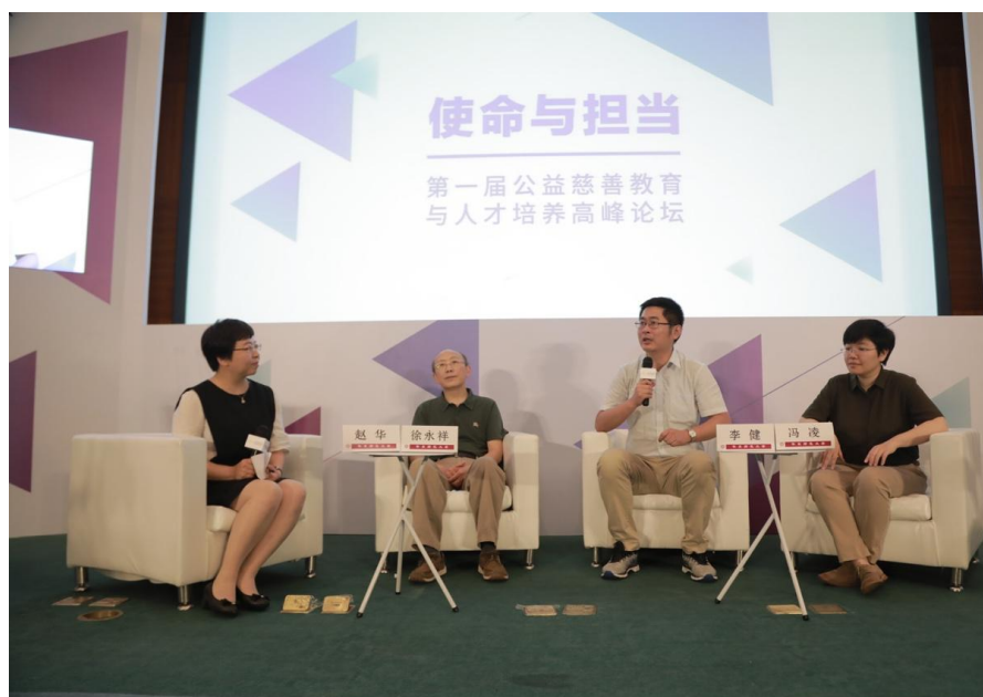
第三场论坛各嘉宾通过圆桌论坛互动交流