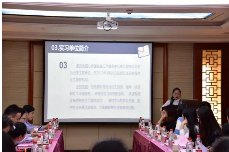
南京师范大学社会工作专业 2017 级本科生黄溶同学 进行实习分享