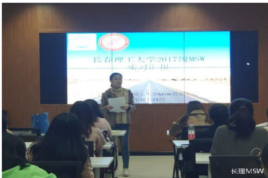
高杉老师进行总结

最后，老师们分别对大家的汇报情况进行了打分，评选出了“最佳优秀实习生”和“优秀实习生”，获奖同学与老师们进行了合影留念。