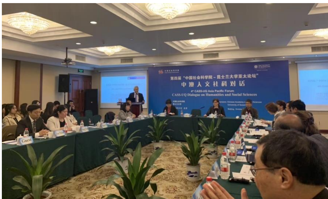
图：第四届“中国社会科学院—昆士兰大学亚太论坛”开幕仪式

2019 年 10 月 23 日，由中国社会科学院、澳大利亚昆士兰大学主办，中国社会科学院社会学研究所、国际合作局承办的第四届“中国社会科学院—昆士兰大学亚太论坛”在北京成功举办。