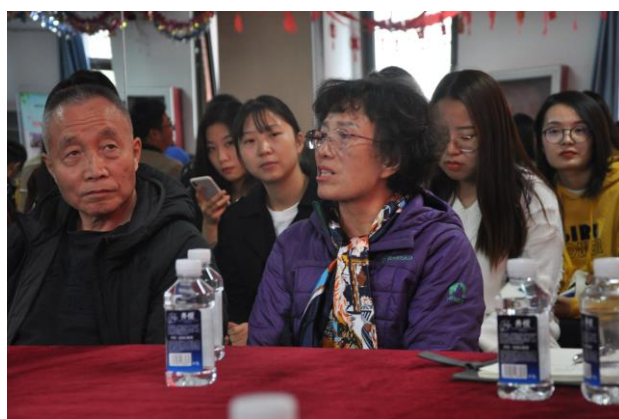
悦然馨苑社区居民骨干发言