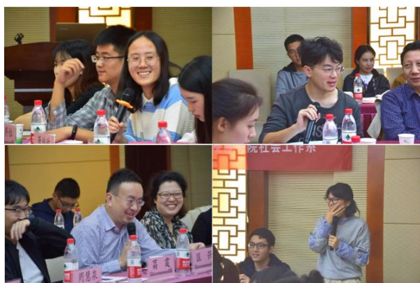
图为 老师同学们在热烈交流

自由交流环节，三校不同年级的同学畅所欲言，围绕实习过程中的细节问题、对实习机构的归属感及对实习安排的期待进行了广泛和深入的探讨。