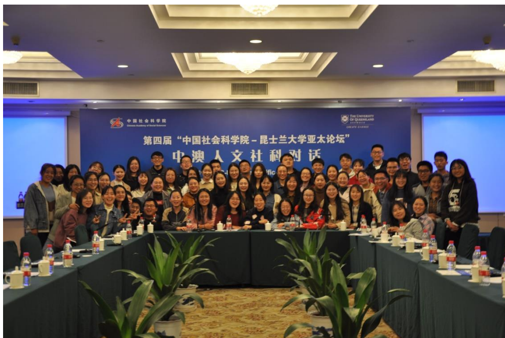
图：2019 级社工学生参加了本次论坛

参加本次学术高端论坛，极大鼓舞了社会工作专业的学生，激励他们立足当下，放眼未来，将所学所思应用于中国实践，以社会工作的力量推动养老、福利、政策等机制的完善，以社会问题的解决加快社会工作本土化历程，以中国力量推动社会工作在国际舞台上发挥更大作用。社会工作与和谐社会融合相生，是每一位社会工作者的责任所在，力量所指！