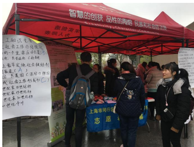
利群机构正在介绍社会工作和招募志愿者