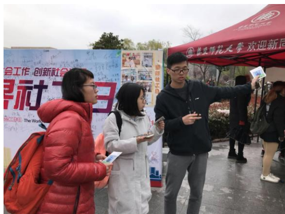
工作人员向同学们介绍寄明信片的活动

签名之后，同学们还收到了精美的社工主题明信片。同学们纷纷在明信片上写下自己最想说的话，之后社工同学将会帮他们把明信片送给他们最想送给的人。本活动意在通过明信片将社会工作的理念介绍到各地。