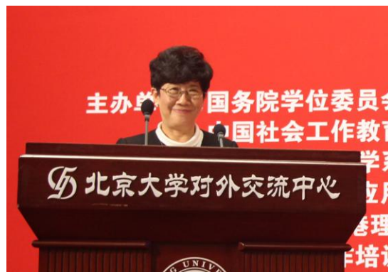
香港理工大学副校长阮曾媛琪致辞