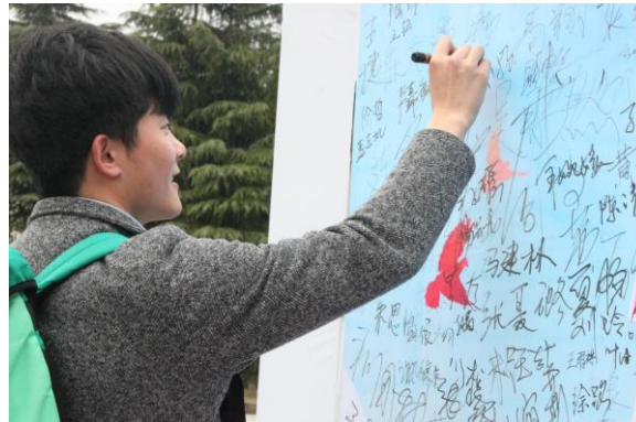
同学们积极签名为社工助力

签名之后，同学们还收到了精美的社工主题明信片。同学们纷纷在明信片上写下自己最想说的话，之后社工同学将会帮他们把明信片送给他们最想送给的人。本活动意在通过明信片将社会工作的理念介绍到各地。