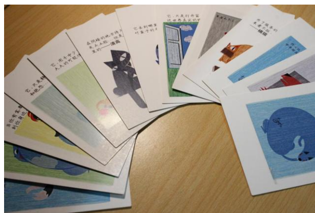
社工系同学认真准备的社工主题日明信片

此外，现场还有“利群”与“九院”机构的实习社工开展的活动，这些实习社工也都是华东师范大学社工系的学生。机构准备了布袋和笔，让大家通过 DIY 的形式，制作属于自己的布袋，为环境的可持续做出自己的一份贡献；机构还邀请了同学们通过合影的方式，将社工理念传播出去；机构还在现场招募大学生志愿者，让同学们能在身体力行中体会与传递社工的价值与爱。