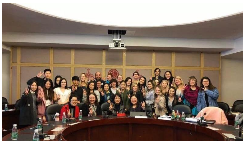
美国南加州大学社会工作学院与南京大学 MSW 师生合影