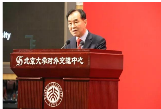
韩国首尔大学Choi Sung Jae专题讲演

两天的研讨会由大会主旨讲演、大会讲演、平行论坛等方式展开。在17号进行的大会主旨讲演阶段，全国老龄办副主任朱耀垠全面介绍了我国人口老龄化、老龄事业发展的情况，介绍了国家老龄政策，指出中国正在整合各种力量，从“五个有所”和健康老年的角度，应对老龄化，期望老年社会工作在中国有更快的发展。韩国首尔大学Choi Sung Jae教授介绍了国际上关于老年人权益的标准和问题，呼吁政府和社会有效地促进老年人权利的实现。香港理工大学黎永亮教授从更宽广的角度理解老年人、老年人的权利和能力方面的问题，社会工作应该根据具体的社会和生活情境去理解老年人的状况、需要和回应。