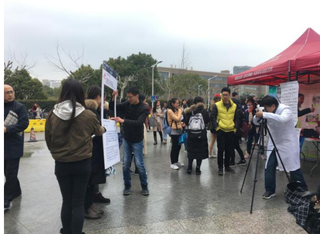
九院医务社工正在邀请路过的同学和老师合影

本次活动宣传了国际社工日，也向全校的同学们展示了社会工作及一群充满激情与理想的社会工作者们。通过这次活动，大家对于社工以及它的价值与追求有了更多的了解。同时，也希望能将社工平等博爱的理念传递的更远。星星之火，可以燎原，相信随着社会工作的迅速发展，这一新兴领域将持续迸发活力，促进实现公平与正义，在为大家带去更多温暖的同时，也为社会主义和谐社会的建设贡献出自己的力量。