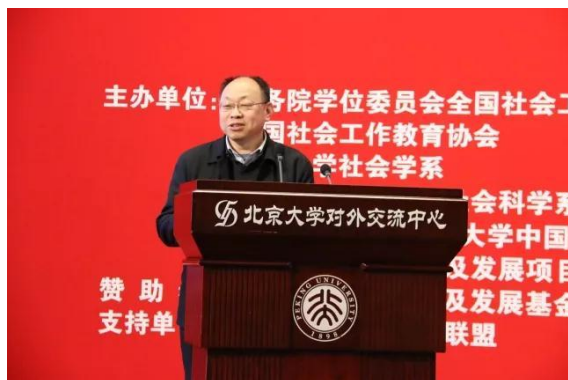
全国老龄办副主任朱耀垠致辞专题讲演