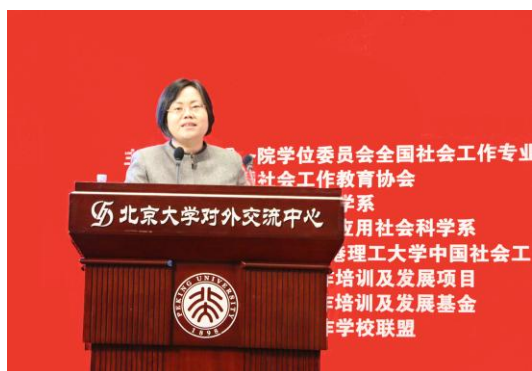
北京大学社会学系查晶书记致辞